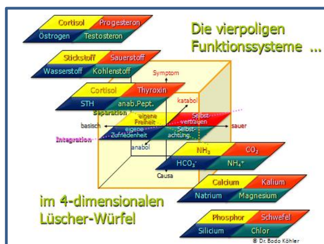
Abb.3: Die verschiedenen funktionellen Aspekte in 4-poliger kategorialer Ordnung

Trotz dieser Darstellung würden die verschiedenen Aspekte der Matrix weiterhin isoliert dastehen, weil schulmedizinisch bisher großzügig auf ein entsprechendes Ordnungssystem verzichtet wurde. Ohne ein solches ist eine Ganzheitsbetrachtung, die auch die vorhandenen Wechselwirkungen aufzeigt, aber nicht möglich. Zum Erstaunen der Fachleute existiert ein solches, universell gültige System seit nunmehr 60 Jahren, in Form des Lüscher-Würfels.